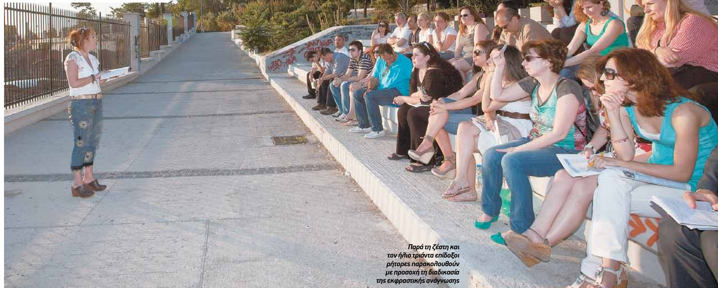
Παρά τη ζέση και τον ήλιο τριάντα επιδοξοί ρήτορες παρακολουθούν με προσοχή τη διαδικασία της εκφραστικής ανάνηψης

Πέμπτη απόγευμα, λίγο πριν από τις επτά. Με τον ήλιο να καίει σχεδόν βασιαντικά πάνω από τα κεφάλια μας και τους υπεύθυνους της διοργάνωσης να φροντίζουν τις τελευταίες λεπτομέρειες λίγα λεπτά πριν καταφθάσουν όλα τα μέλη του ομίλου, η 49η συνάντηση του ελληνικού Toastmaster Club μπροστά από το αρχαίο νεκροταφείο των Αθηνών μια ομάδα τριάντα ανθρώπων συγκεντρώθηκε όχι απλώς για βόλτα και κουβέντα, αλλά για εξάσκηση των ικανοτήτων δημόσιας ομιλίας μπροστά σε κοινό με τις ίδιες ανησυχίες, ενδιαφέροντα και βλέψεις. Οι λόγοι που τους οδηγούν κάθε πρώτη και κάθε τρίτη Πέμπτη του μήνα σε διαφορετικά συνήθως σημεία της Αθήνας είναι πολλοί και διαφορετικοί. Κάποιοι, για επαγγελματικούς λόγους, επιδιώ-